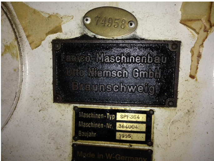
Lanico SPF 6-364 pestañadora de rulinas CPN 3910 - Página 2 de 2