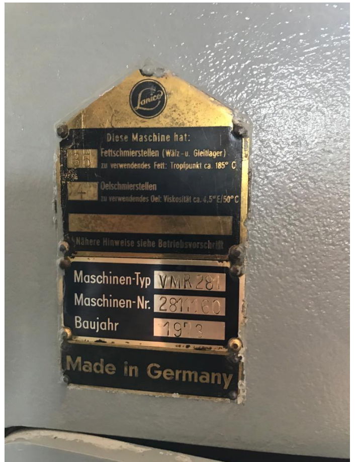
Lanico VMR 281 cerradora semiautomática CPN 5575 - Página 2 de 2