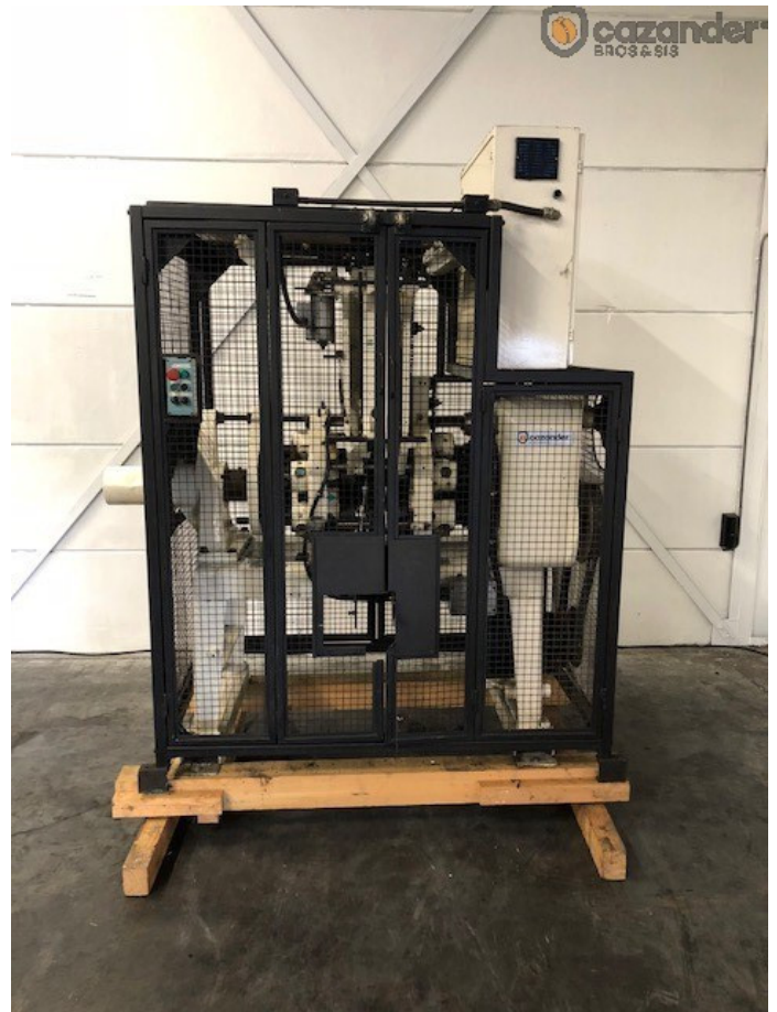
Metal Box 65D pestañadora de rulinas CPN 4395 - Página 5 de 5